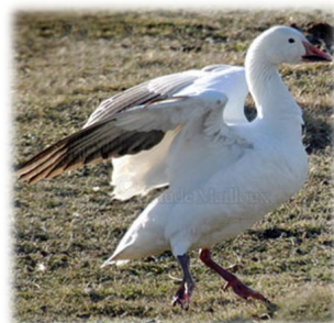
Grande oie des neiges.

Centre d'interprétation Baie-du-Febvre www.oies.com