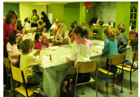
Les petits artistes à l'œuvre, aidés des enseignantes et de la responsable.