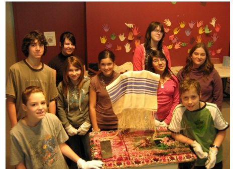
Le groupe d'élèves posant fièrement devant la vitrine montée par l'équipe des garçons

tité d'objets qui s'y trouvent. En effet, plus de 100 000 objets de la collection sont conservés dans le sous-sol du Musée des religions du monde. Les jeunes étaient attentifs à toutes les explications données par Mathieu. Évidemment, ce dernier a dû répondre à différentes questions de la part des curieux pendant la visite !