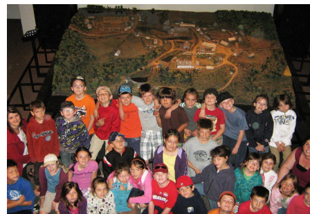
Le groupe d'élèves et deux éducatrices, devant la maquette du village des Forges-du-Saint-Maurice.

Je dois préciser que d'autres ateliers se tenaient au même moment, avec les autres groupes. Ainsi, les plus jeunes ont participé à l'atelier « Mobilier », manipulant des reproductions à échelle réduite du mobilier de l'époque alors que les plus vieux participaient à l'atelier « Costumes », utilisant des costumes historiques et exprimant les différences avec l'habillement d'aujourd'hui.