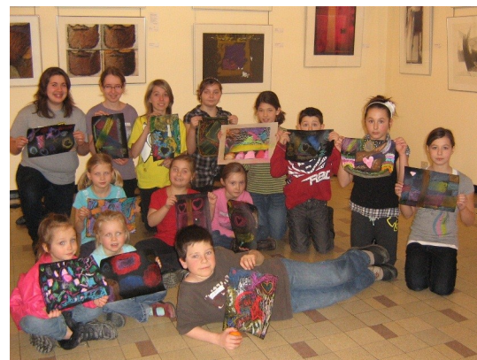
La création des jeunes, inspirés en l'œuvre de l'artiste Marcel Bellerive

La deuxième création était une œuvre figurative. Les jeunes se sont inspirés d'images d'animaux afin de créer un dessin avec les crayons de couleur. Ils ont tracé des figures sur un papier à dessin, puis les ont coloriées. Le type de crayon employé permettait de faire des tracés plus fins et de superposer les figures et les couleurs. Les jeunes ont pu établir la différence entre une œuvre abstraite et une œuvre figurative.