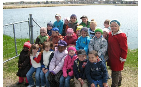
Le groupe d'élèves en compagnie de leur enseignante, aux abords d'un bassin d'observation des canards.

Enfin, la dernière partie de l'avant-midi se déroulait dehors, au tunnel d'affût, où se trouvent des bassins d'eau qui accueillent les canards. Les enfants étaient excités de pouvoir observer les canards de si près, à l'aide de télescopes.