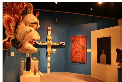
Une section de l'actuelle exposition permanente, Culte et collection