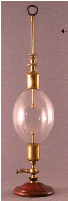
Œuf électrique (Musée Pierre-Boucher à Trois-Rivières)

On encourage l'interaction, les échanges, entre le locuteur et les auditeurs. Ainsi, les questions et commentaires de ces derniers sont les bienvenus tout au long de la présentation, qui prend davantage la forme d'une discussion en grand groupe que d'une « conférence ».