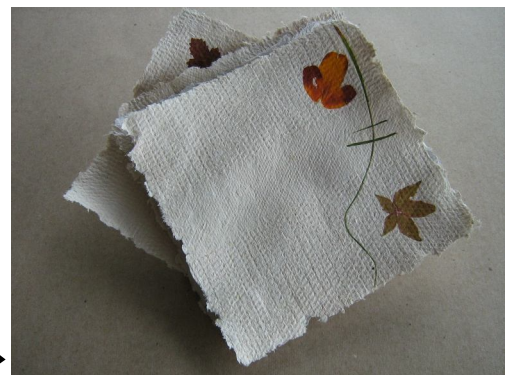
Papier recyclé (Centre d'exposition sur l'industrie des pâtes et papiers de Trois-Rivières)