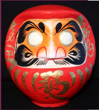
Daruma (Musée des religions du monde de Nicolet)